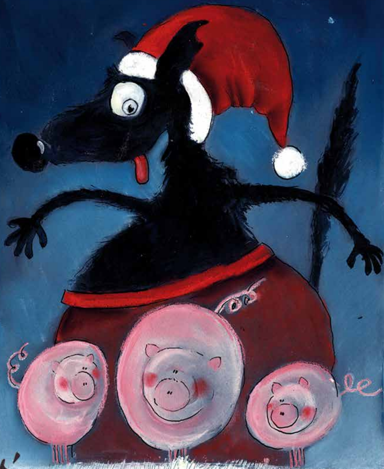
Illustration de Sophie Bernert